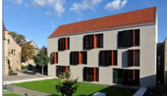
Waidhaus auf dem Gelände des Augustinerklosters