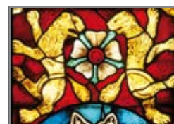
Lutherrose im Löwen- und Papageienfenster der Kirche

montags 20:00 – 21:30 Uhr Offener Meditationsabend schweigendes Gebet im Meditationsraum im Waidhaus (nicht an Feiertagen und in den Thüringer Sommerferien)