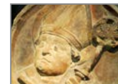
Augustinus v. Hippo (Schlusstein)