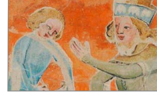
Secco in der Elisabethkapelle (Ausschnitt)