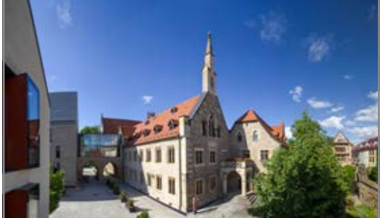
Ensemble des Augustinerklosters