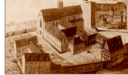
Ansicht der Klosteranlage, Zustand nach 1669

Führungen für Gruppen sind nach vorheriger Anmeldung möglich.