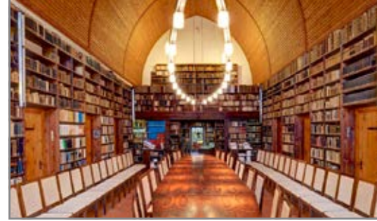
Historische Bibliothek im Augustinerkloster

Der Verein verfolgt ausschließlich und unmittelbar gemeinnützige Zwecke im Sinne des Abschnitts „Steuerbegünstigte Zwecke“ der Abgabenordnung.