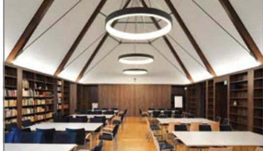
Raum Augustinus im Haus der Versöhnung