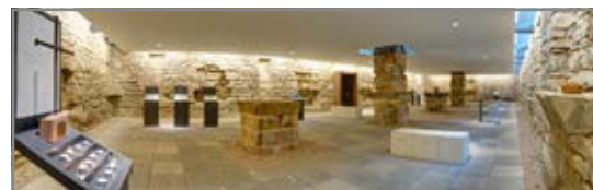
Ort der Stille

Sie sind eingeladen, jeden Tag mit uns zu beten. Die Mittagsgebete finden um 12:00 Uhr, die Abendgebete um 18:00 Uhr statt. In den Sommermonaten beten wir am Dienstagabend in der Elisabethkapelle im Nikolaiturm, ganz in der Nachbarschaft des Klosters. Jeden Donnerstagabend halten wir ein englisches Abendgebet.