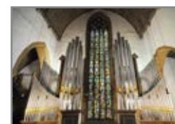
Walcker-Orgel in der Kirche