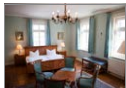
Blick in ein Zimmer