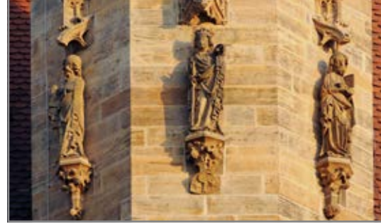
Turmfikuren der Augustinerkirche, Restaurierung finanziell unterstützt durch den Freundeskreis

TAGEN & BEGEGNEN evangelisch gastfreundlich