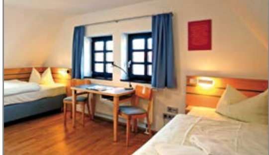
Blick in ein Gästezimmer